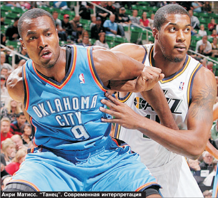
Анри Матисс. “Танец”. Современная интерпретация