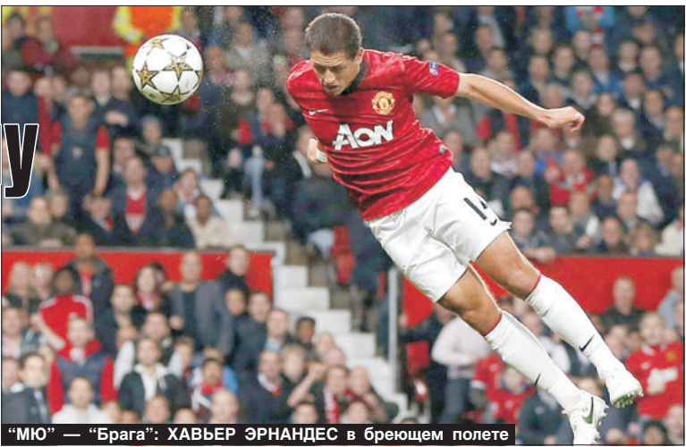
“МЮ” — “Брага”: ХАВЬЕР ЭРНАНДЕС в бреющем полете