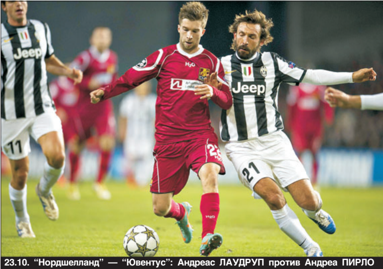
23.10. “Нордшелланд” — “Ювентус”: Андреас ЛАУДРУП против Андреа ПИРЛО

(3:1 и 4:1), “Днепром” (2:1), “Металлистом” (2:0). То есть хотя бы с теми командами, на слуху в Европе. И с подобающим вниманием отнестись к показателям горняков в нынешнем сезоне. А они перед матчем с “Челси” были великопелны: в 16 играх — 15 побед и одна ничья. А после встречи с лондонским клубом стали еще лучше.